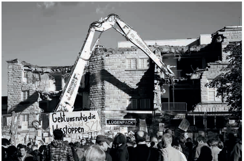
Abriss des Bahnhof-Nordflügels im August 2010. Bis heute ist das Gelände eine Baubrache.

Mittwoch, 15. Februar, 19:00 Uhr: Stresstest – was nun? Bürgerhaus S-Feuerbach, Stuttgarter Str. 15, 1. OG; Veranstalter: NaturFreunde Feuerbach & Initiative Feuerbach für K21