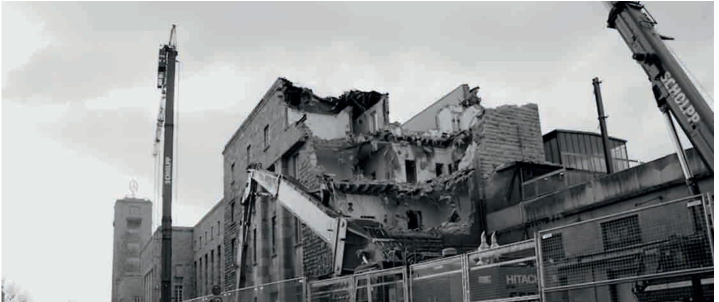
Erst zerstören, dann planen: schweres Gerät beim Abbruch des Bahnhof-Südflügels

NEUES VOM DÜMMSTEN BAHNPROJEKT DER WELT – AUSGABE 4 • 9. FEBRUAR 2012